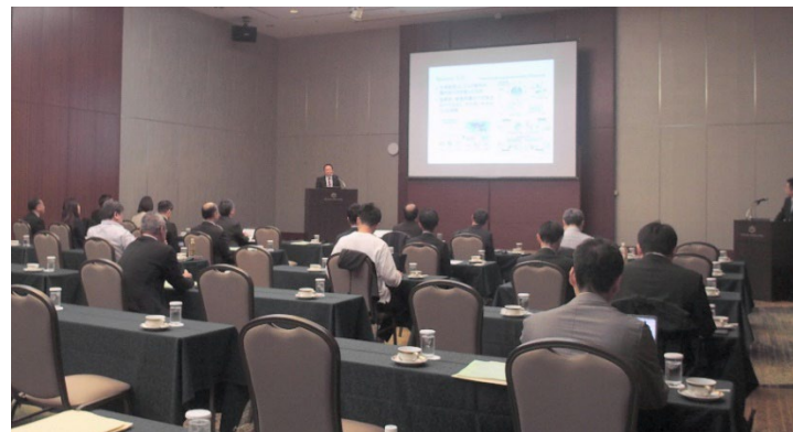
セミナー会場の様子