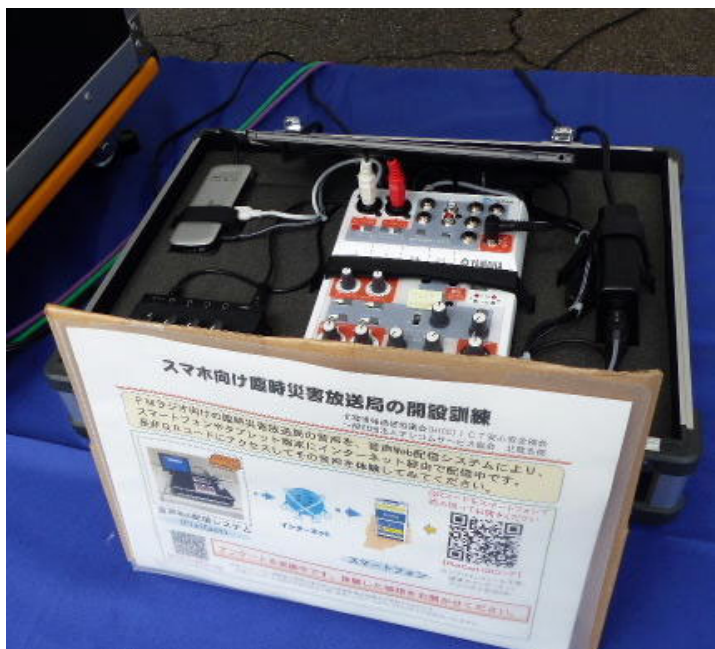
音声web配信システム

この訓練は、大雨や地震による被災に伴い、地域住民や滞在者に対して緊急避難情報や被災者支援情報を発信する必要があるとの想定のもと、北陸総合通信局が高岡市に臨時災害放送局設備（FM設備）を貸与し、高岡市がその臨時災害放送局を開設して地域住民に情報を伝達するものです。