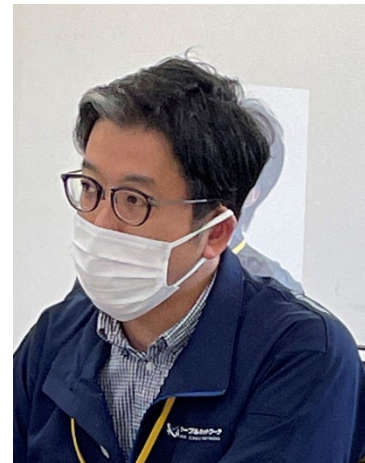
高岡ケーブルネットワーク 様

この情報交換会では、HICC会員、北陸3県の自治体及びICT関連企業などを対象に、高岡ケーブルネットワーク株式会社様からローカル5Gへの取り組み、となみ衛星通信テレビ株式会社様からL5Gを含めた無線事業による地域活性化について、一般社団法人電波産業会様から、ローカル5G等の実現に向けた開発実証とローカル5G官民連絡会の活動開始についてご講演をいただきました。