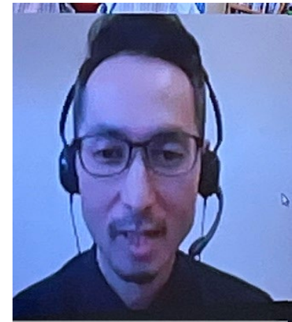
となみ衛星通信テレビ 様