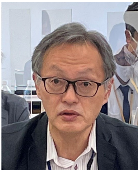
蒲生局長 開会挨拶