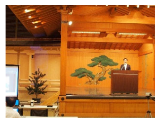
会場となった福井市ハピリンホール （能舞台に演台を置いて講演・挨拶）