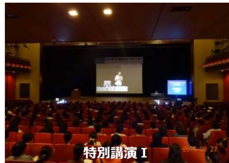
【邦楽ホールにおける4K映像】

実証実験では、メイン会場であるコンサートホールの模様を4K超高精細映像で邦楽ホールのメインスクリーンに投影し、主催者・運営者、及びコンベンション出席者に4Kネットワークコンベンションの有用性、臨場感、改善点等のアンケートを実施し、実用化に向けた課題を探りました。