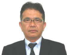
総務省総合通信基盤局 電波部長 渡辺 克也 氏

「第5世代移動通信システム(5G)」や自動走行等の「次世代ITS」の早期実現に向けた国内外の取組、ロボット(ドローン等)の電波利用の高度化に向けた取組など、電波政策の動向について紹介する。