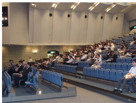
講演時のセミナー会場